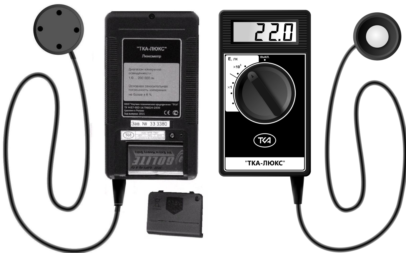
Рис.2 Внешний вид прибора (вид снизу и вид сверху)