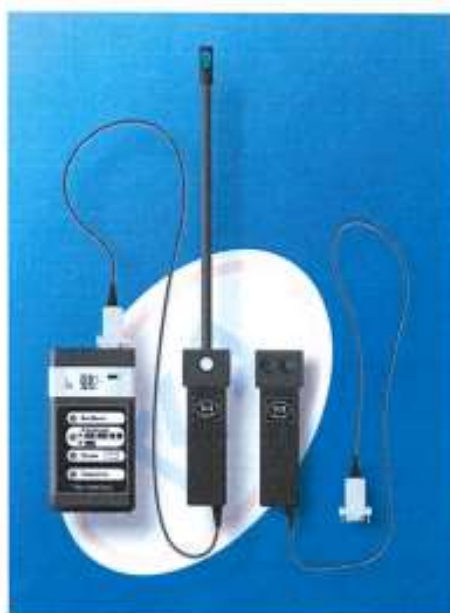
Рисунок 1 — Внешний вид прибора

Приборы комбинированные выпускаются в компактном портативном исполнении. На корпусе прибора расположены: жидкокристаллический индикатор, органы управления, маркировки и выносной зонд с датчиками измеряемых параметров. В зависимости от состава и количества измеряемых параметров зонд может быть установлен либо на корпусе прибора, либо на измерительной головке, соединённой с основным корпусом кабелем связи. Внешний вид прибора приведен на рисунке 1.