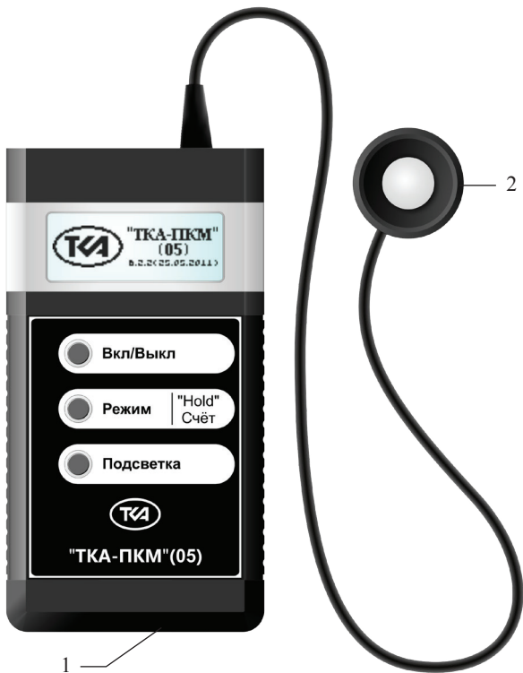
Рис.1 – Внешний вид прибора “TKA-ПКМ”(05) 1 – Блок обработки информации 2 – Измерительная головка