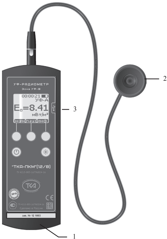
Рис.1 – Внешний вид прибора “ТКА-ПКМ”(12/В)