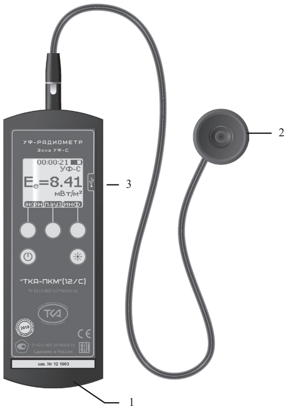
Рис.1 – Внешний вид прибора “ТКА-ПКМ”(12/С)