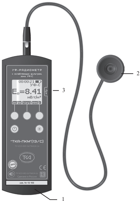
Рис.1 – Внешний вид прибора “ТКА-ПКМ”(13/С)