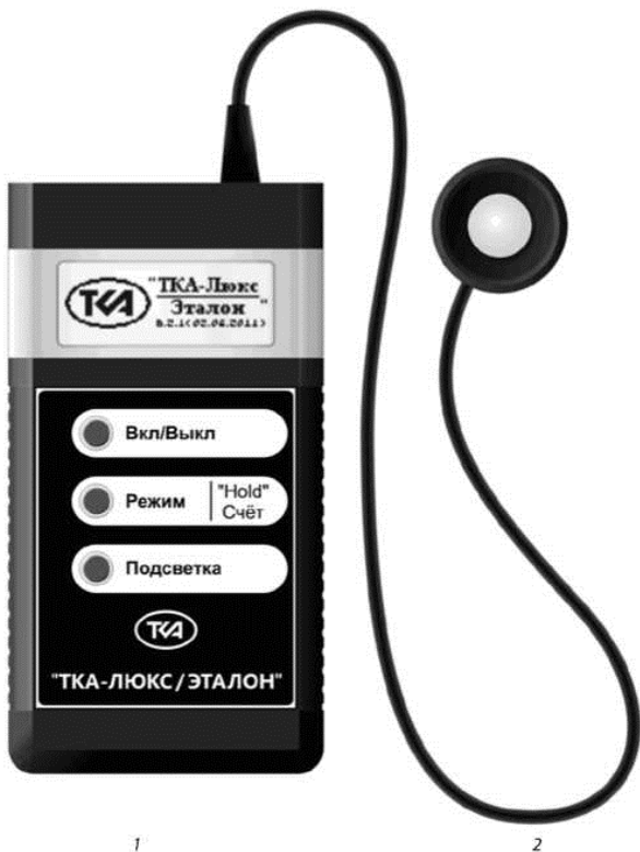
Рис. 1. Внешний вид Люксметра 1 – блок обработки сигнала, 2 – фотометрическая головка