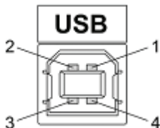
Рис. 2 – Разъем USB (розетка “B”) 1 – питание (+5В); 2 – линия D-; 3 – линия D+; 4 – общий (земля)

открыть файл с записанным протоколом измерений.