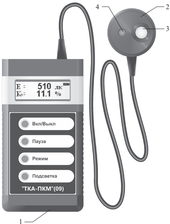
Рис.1 – Внешний вид прибора “ТКА-ПКМ”(09)