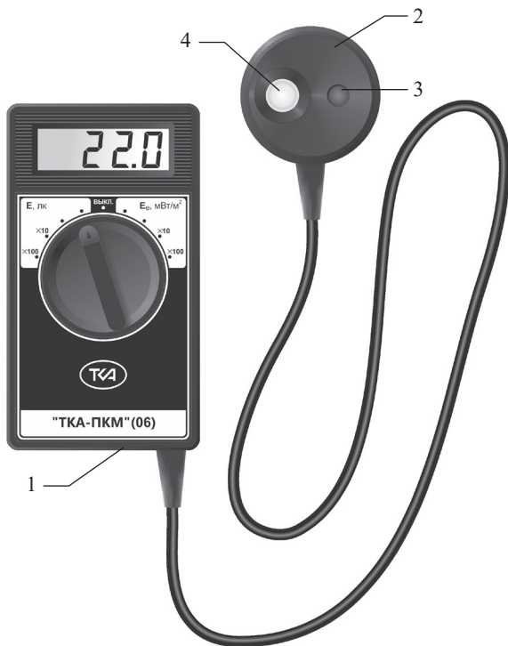
Рис.1 – Внешний вид прибора “ТКА-ПКМ”(06)