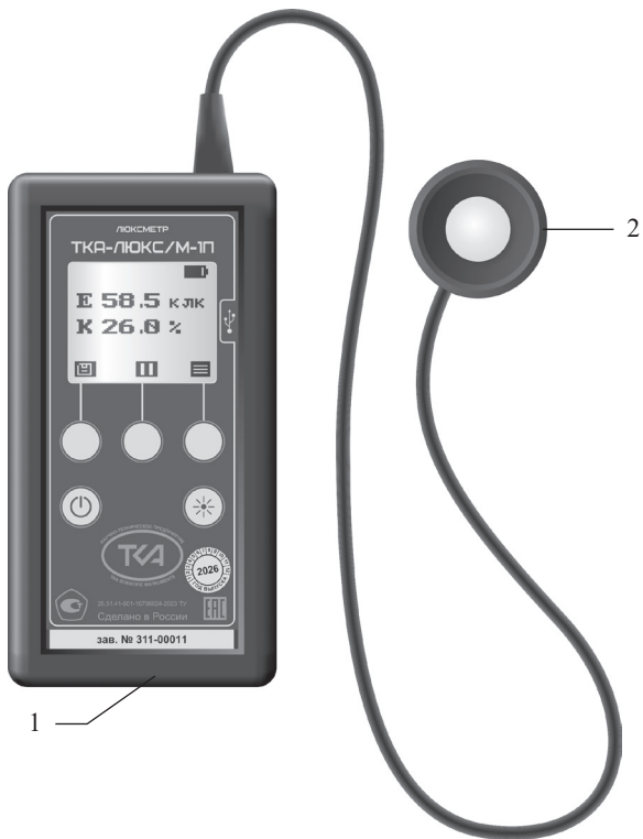
Рис.1 Внешний вид прибора ТКА-Люкс/М-1П